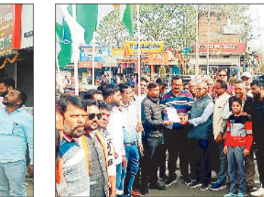
ज्ञापन सौंपते कांग्रेसी।

हटाकर प्रशासनिक योजना के रूप में सीमित किया जा रहा है, जिससे देकर श्रमिकों का शोषण किया जा रहा है। छग प्रदेश में धान खरीदी की प्रक्रिया भी गंभीर अवस्थाओं से जूझ रही है। प्रदेश के अनेक खरीदी केन्द्रों में धान खरीदी अत्यंत धीमी