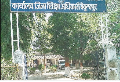
5 हजार से अधिक विद्यार्थी होंगे शामिल

माशिम द्वारा आयोजित 10 वीं और 12 वीं बोर्ड परीक्षा की परीक्षा को लेकर तैयारियां शुरू हो गई हैं। इस वर्ष 10 वीं एवं 12 वीं बोर्ड की परीक्षा फरवरी के दूसरे पखवाड़े में शुरू हो जाएगी, इसे लेकर जिले में शिक्षा विभाग द्वारा बोर्ड परीक्षा की तैयारियां शुरू कर दी गई हैं। इसके पूर्व के वर्षों में उक्त बोर्ड की परीक्षा मार्च के महीने में शुरू होती थी, लेकिन इस वर्ष फरवरी के दूसरे पखवाड़े में ही उक्त कक्षाओं की परीक्षा शुरू कर दी जाएगी, इसके लिए समय-समय पर माशिम द्वारा घोषित की जा चुकी है। बोर्ड परीक्षा में बेहतर प्रदर्शन के लिए प्रो बोर्ड की परीक्षा भी संपन्न गई और प्रायोगिक परीक्षा का कार्य भी पूर्णता की ओर है। जिले के विद्यालयों में पढ़ाई जोर शोर से चल रहा है और जिला कलेक्टर पर ध्यान ध्यान देने के निर्देश दिए गए हैं। मिशन के तहत बोर्ड के विद्यार्थियों की तैयारी कराई जा रही है। कलेक्टर के मार्गदर्शन में बोते वर्ष कोरिया जिले में बोर्ड परीक्षा के नतीजे काफी बेहतर रहा और इस वर्ष भी कोरिया जिले को बेहतर प्रदर्शन करने के