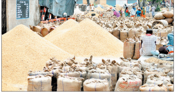
धान खरीदी केन्द्र।

शहर में 29 जनवरी को गोंगपा ने रैली निकालकर धान खरीदी की अवधि बढ़ाने की मांग को लेकर अधिकारियों को ज्ञापन सौंपा, वहीं कांग्रेस ने भी धरना प्रदर्शन कर धान खरीदी की समय-सीमा बढ़ाने की मांग की, लेकिन सरकार द्वारा अब तक कोई निर्णय समय-सीमा बढ़ाने को लेकर नहीं लिया जा सका है, ऐसे में 31 जनवरी को धान खरीदी का अंतिम दिवस होगा। इस वर्ष कोरिया जिले में धान का बम्पर उत्पादन हुआ था।