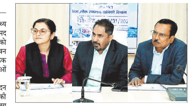
बैठक लेते सचिव।